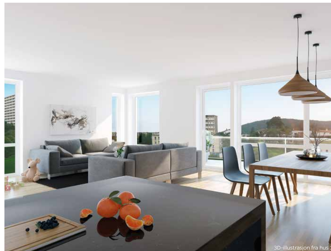
3D-illustrasjon fra hus 1