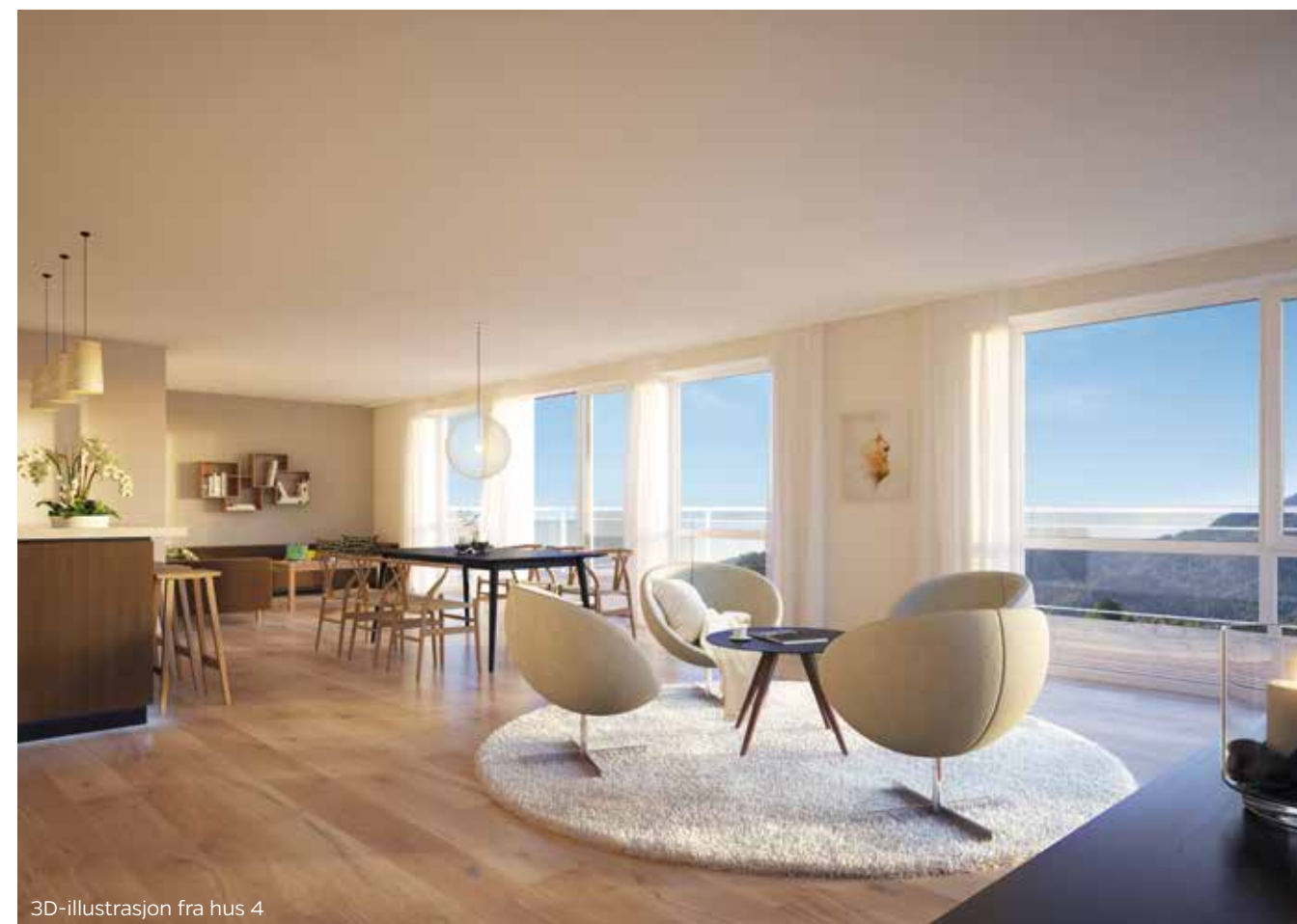
3D-illustrasjon fra hus 4